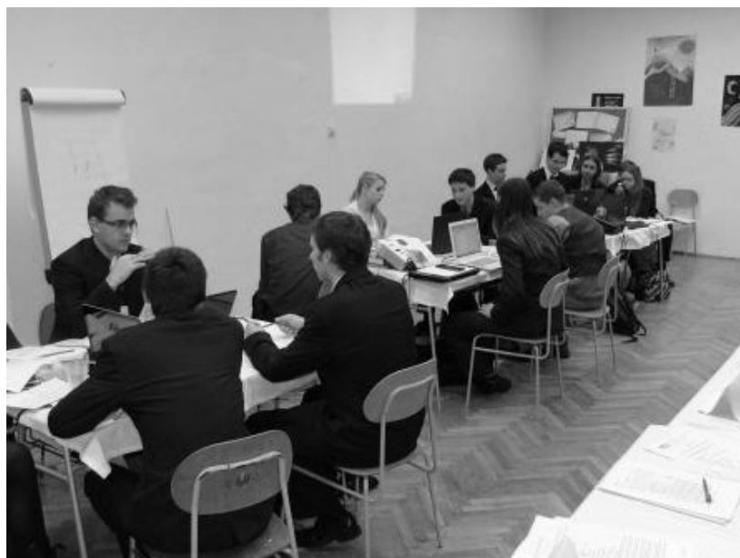
Obrázek 2 Regionální kolo TMF v Opavě, 2012